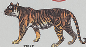
TIGRE Felis tigris Ásia

COM AS ILUSTRAÇÕES ORIGINÁIS DEYROLLE NATUREZA ARTE EDUCAÇÃO