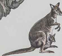
CANGURU-DE-BENNETT Macrotis benettii Austrália