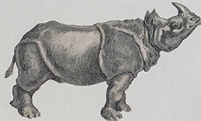
RINOCERONTE-INDIANO Rhinoceros unicornis Ásia