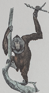
ORANGOTANGO- DE-BORNEU Pongo pygmaeus Borneu